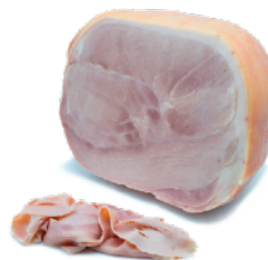
IMMAGINE PRODOTTO (da catalogo a titolo esemplificativo) Product image as example

Non forare la confezione. Aprire la confezione 10 minuti prima di affettare. Do not pierce the package. Open the pack 10 minutes before slicing.